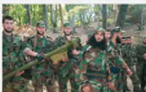
Чеченская Республика, 9 июня 2002 г. Представитель «Аль-Каиды» Абу аль-Валид – уничтожен