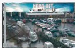
Москва, Дубровка, 25 октября 2002 г.