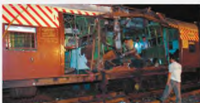
Мумбаи, Индия, 11 июля 2008 г.

Политическая организация, взявшая на вооружение террористические методы борьбы, со временем перерождается в преступную группировку, прикрывающуюся политическими лозунгами.