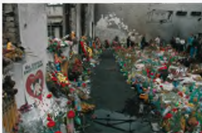
Беслан, сентябрь 2004 г.