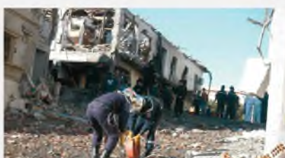
Тене, Алжир, 29 января 2008 г.

Националистический терроризм органически связан с сепаратизмом, направленным на изменение существующего государственного устройства, правового статуса национально-государственных или административно-территориальных образований, нарушение территориального единства страны, выход тех или иных территориальных единиц из состава государства, образование собственного независимого государства. Осуществляется организациями этносепаратистской направленности с целью ликвидации экономического и политического диктата национальных государств (например, «Ирландская республиканская армия» (Северная Ирландия), «Рабочая партия Курдистана» (Турция), «Батасуна» – «ЭТА» (Испания), «Фронт национального освобождения Киргизии» (Франция), «Фронт освобождения Кавказа» (Кавказ), «Вооруженный союз националистов освобождения» (Пурто-Рико, США), «Тигра освобождения Тамил Ислам» (Шри-Ланка), «УНИТА» (Ангола) и др.).