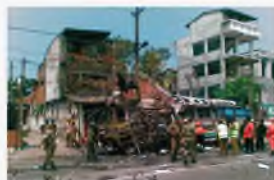
Коломбо, Шри-Ланка, 23 февраля 2008 г.