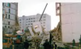
Каспиysк, 16 ноября 1996 г.