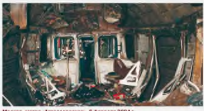
Москва, метро «Анзаводская», 6 февраля 2004 г.

С религиозным терроризмом тесно ассоциирован ряд сепаратистских движений в штате Колорадо (Индия), на Филиппинах, в Чеченской Республике. Примеры – «Аль-Каида», движение «Талибан» (Афганистан), «Батальи мусульман» (Египет), «Абу Сайеф» (Филиппины), «Ансар аль-Ислам» (Ирак), «Асбат аль-Ансар», «Ульма ут-Таджир аль-Ислами» (Ливан), «Аум Синрикё» (Япония) и другие.