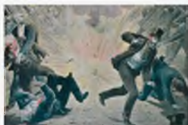
Анише, Франция. 1895 г. Терракт анархиста

В XXI в. просматривается тенденция к расширению масштабов и географии террористической деятельности. Увеличивается число террористических актов, совершаемых с целью личного обогащения. Растет число террористических актов на почве политического противоборства различных сил, а также на почве межэтнических и межконфессиональных противоречий.