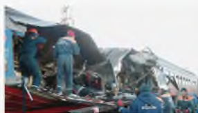
Ессентуки, 5 декабря 2003 г.