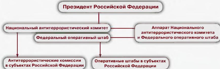
Схема координации противодействия терроризму в Российской Федерации

Важнейшим инструментом антитеррористической политики является осведомленность, то есть знание и готовность к действиям в чрезвычайной ситуации