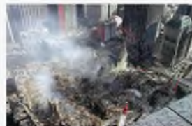
Нью-Йорк, США, 11 сентября 2001 г.

Терроризм по своим масштабам, непредсказуемости и последствиям превратился в одну из наиболее опасных общественно-политических и моральных проблем, с которыми человечество вошло в XXI столетие