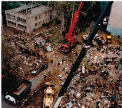
Москва, Каширское шоссе, 13 сентября 1999 г.

Департамент по борьбе с организованной преступностью и терроризмом МВД России