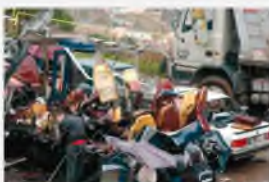
Айн-Аль-Ливан, 13 февраля 2007 г. Взрыв в христианском квартале

Лишенные поддержки иностранных государств и их спецслужб, террористы не смогут продолжать свою деятельность в прежнем объеме.