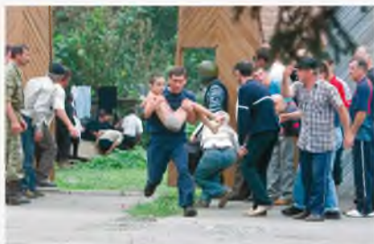
Беслан, сентябрь 2004 г.

Никто, к сожалению, не защищен от ситуации, когда может оказаться в заложниках у террористов