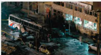
Димечир, Турция, 1 марта 2008 г.

Кибертерроризм представляет серьезную угрозу для человечества, сравнимую с ядерным, бактериологическим и химическим оружием, причем степень этой угрозы в силу своей новизны до конца еще не осознана и не изучена.