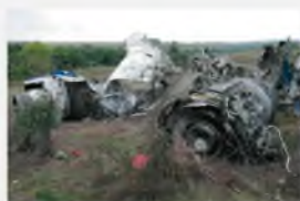
Ростовская область, 24 августа 2004 г. Теракт на борту Ту-154 – место падения

Российская Федерация активно поддерживает усилия мирового сообщества по борьбе с международным терроризмом